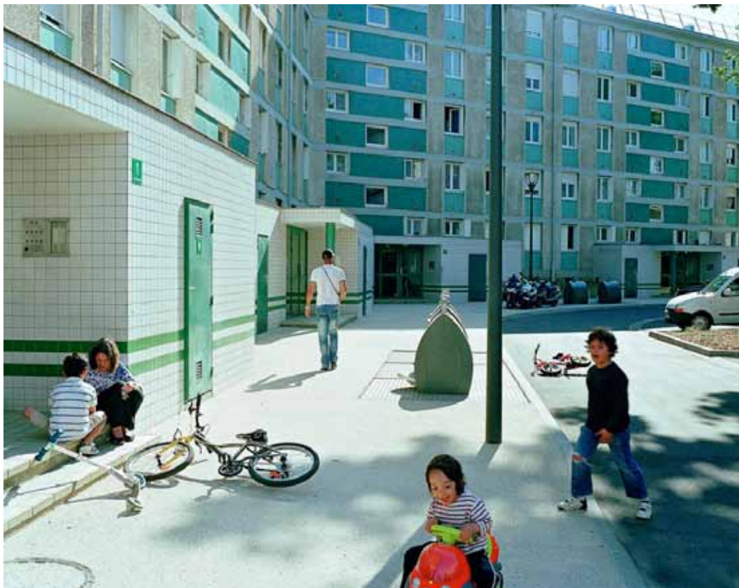
Orly-Ville, mai 2011